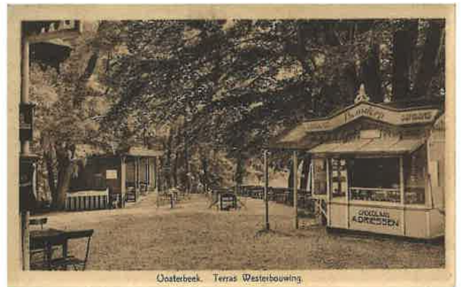
Kiosk bij terras Westerbouwing, Oosterbeek