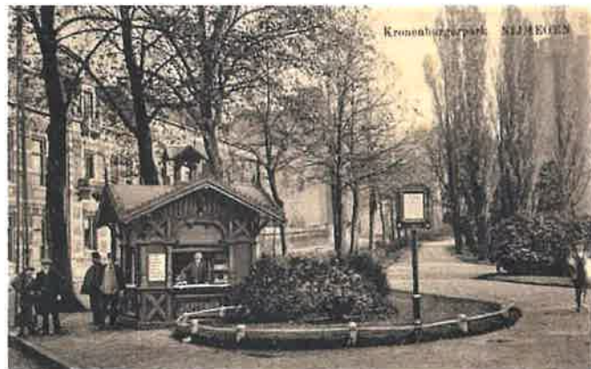
Peemankeetje, Kronenburgerpark, Nijmegen

De naam, u zult het al weten, wordt over heel Europa gebruikt maar komt feitelijk uit het Turks: köshk , voor paviljoentje/lusthuisje, en komt in gebruik deels weer overeen met onze Hollandse koepel. Het boek opent met een gedegen inleiding over die Turkse origine en over het verschijnsel kiosk en aanverwanten in de tuinkunst. De commerciële kiosk, waar in dit boek terecht de nadruk op ligt, wordt in haar vele (ook in de buitenlandse) verschijningsvormen gepresenteerd, uitgelegd, gedocumenteerd en getoond: Beaux Arts-stijl, Zwitserse/chaletstijl, respectievelijk neo-vakwerk, historisme, Berlagiaans, Amsterdamse School, Delftse School, voluit-Modernisme, Postmodernisme, en natuurlijk vooral en bovenal het eigenzinnige gefröbel van de doorsnee snack- of bloemenkiosk. Ze blijken maar al te vaak, daar-zijn-we-weer!, een doorn in het oog van de stedelijke overheden die natuurlijk alles goed gereguleerd willen hebben. Strak in de rijen, hup, marcheren! En vooral luisteren naar de ambtenaar en zijn meesters. Helaas verdwijnen hierdoor de anarchie, slecht geoutilleerde, en bij tijd en wijle levensgevaarlijke (dankzij salmonella, brandgevaar, en ontplofende gasflessen), krakkemikkige bouwwerkjes met grote snelheid en worden door niets vervangen of zijn inmiddels uit de markt geduwd door een goedgekeurd gebouwtje-onder-architectuur. Er zijn kiosken, ook de onder architectuur gebouwde, die men het liefst in de zak zou steken en meenemen. Het merendeel zelfs.