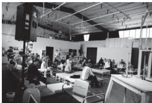
4. Olafur Eliasson, Life in Space (LIS) symposium , 2006, photographie du studio Olafur Eliasson, Berlin.

Dans The Artist's Studio , deux articles se penchent également sur l'interpénétration du lieu de création de l'œuvre et de l'œuvre proprement dite, avec tout ce que cela implique. Martin Postle, à propos du motif de l'atelier bohème dans la peinture et la littérature, adopte